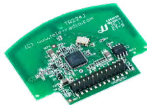
CL-TR224-1 CL-TR224-3 CL-TR304-1