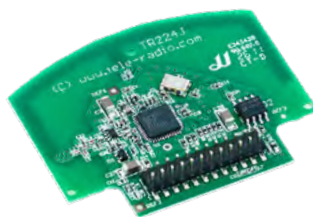
CL-TR224-1 CL-TR224-3 CL-TR304-1