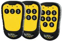
Émetteur compact PN-T7